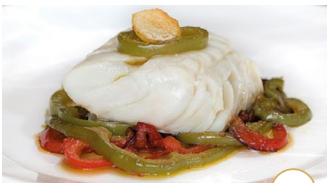
Lomo de bacalao con pimientos