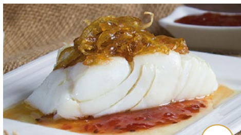
Lomo de bacalao con cebolla caramelizada