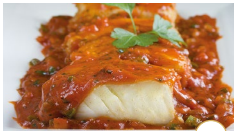
Lomitos a la vizcaína