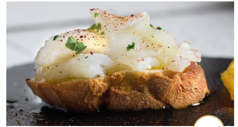
Migas en carpaccio sobre tosta de pan