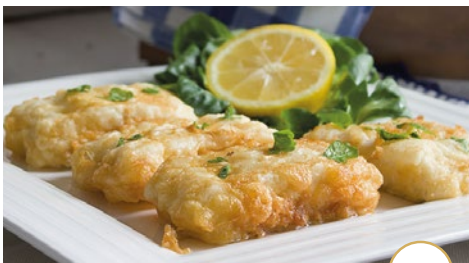
Fritos (bacalao rebozado)