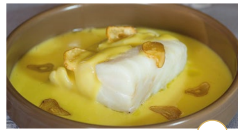
Lomo de bacalao al pil-pil