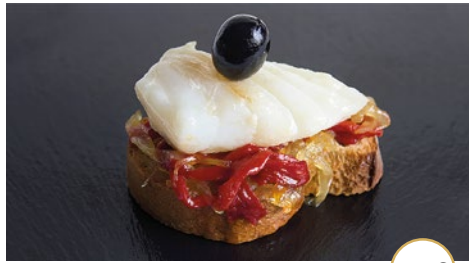
Pincho de ventresca con pimientos y cebolla