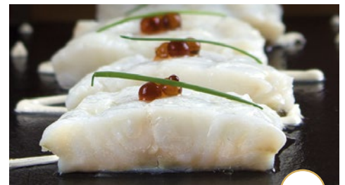
Lomitos confitados con salsa ali-oli