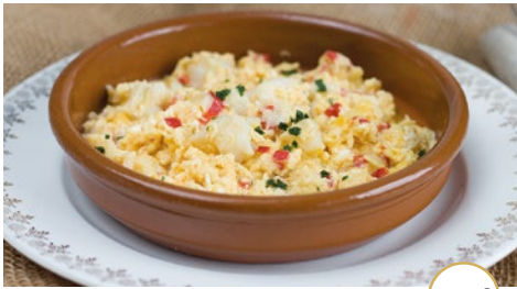
Revuelto de ventresca